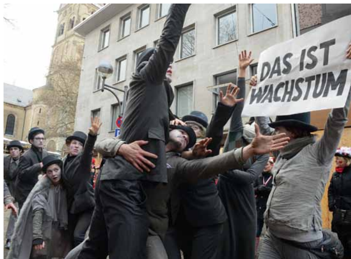
»Wachstumskritisch aus der Reihe tanzen«