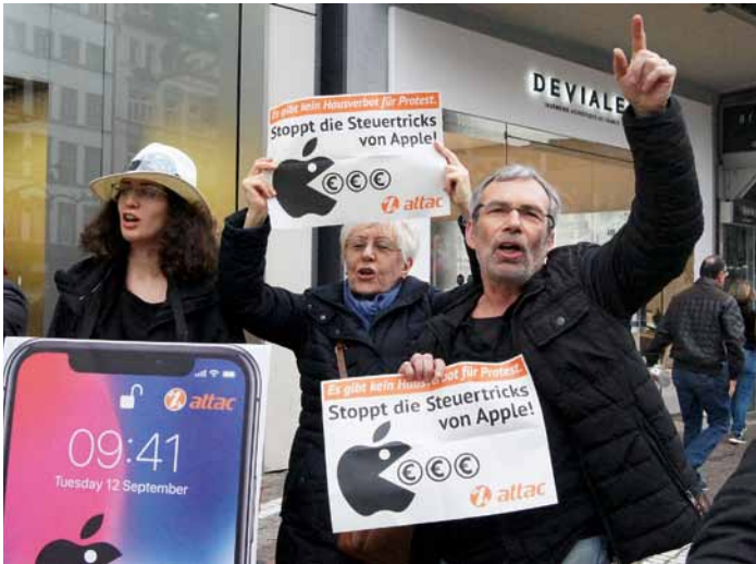
Flashmob im Frankfurter Apple Store, Foto: Stephanie Handtmann