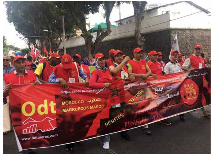
Weltsozialforum in Salvador de Bahia

zige Vereine zu sorgen, statt das Engagement von Attac zu behindern.