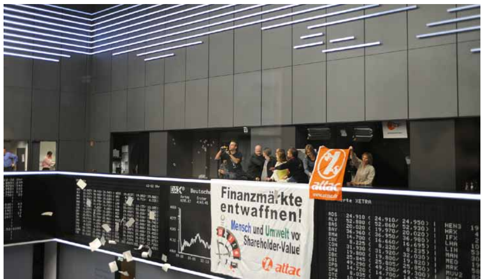
Aktiv werden, ohne Verschwörungsideologien zu bedienen, Foto: Sami Atwa

Wenn ich Verschwörungsideologien kritisiere, sage ich nicht, dass es keine Verschwörungen gebe. 1961 versuchte die CIA mit Hilfe von Exilkubanern die kubanische Regierung zu stürzen. Das war eindeutig eine Verschwö-