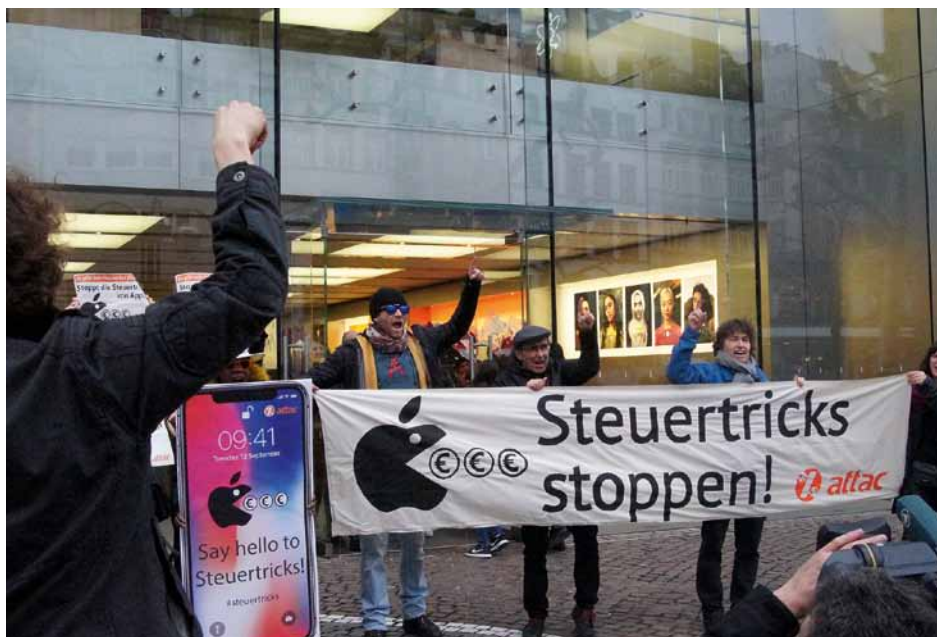
Flashmob im Frankfurter Apple Store, Foto: Stephanie Handtmann

Weltweit gehen durch Steuertricks von Konzernen jedes Jahr mindestens 500 Milliarden Euro verloren – allein in Deutschland sind es etwa 17 Milliarden. Der globale Süden ist davon besonders betroffen; dort übertrifft die Steuerflucht die gesamte Entwicklungshilfe. Attac kämpft für Steuergerechtigkeit und einen Systemwechsel hin zu einer Gesamtkonzernsteuer. Diese sieht vor, dass die Gewinne des gesamten Konzerns statt der einzelnen Tochterunternehmen betrachtet und dort besteuert werden, wo sie erwirtschaftet werden. Gewinnverschiebung in Steueroasen ist so nicht mehr möglich. Die Mehreinnahmen durch eine gerechte Konzernbesteuerung wären so hoch, dass wir den gesamten Nahverkehr kostenlos machen könnten. Alternativ könnten 110.000 Sozialwohnungen oder 560.000 Kita-Plätze finanziert werden. Stattdessen landet das Geld heute bei Managern und Aktionären.