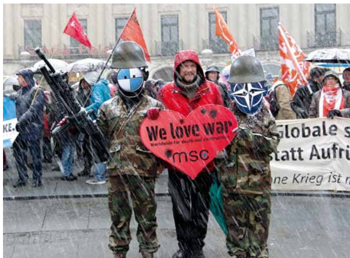
Proteste gegen Sicherheitskonferenz in München, Foto: Attac.de