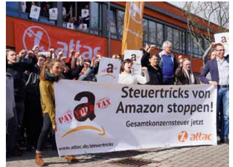
Attacies beim Ratschlag in Bamberg, 2018

In den vergangenen Monaten haben wir uns im Rahmen einer europaweiten Attac-Kampagne gegen die Steuertricks multinationaler Konzerne mit Aktionen zu Apple und Amazon für die Einführung einer Gesamtkonzernsteuer engagiert, und auch in den nächsten Monaten haben wir noch viel vor. Natürlich sind Apple und andere Digitalunternehmen wie Amazon oder SAP, die wir in den Fokus nehmen, Beispiele unter vielen, die für diese Kampagne als gutes schlechtes Beispiel dienen. Wir fordern die Einführung von Mindeststeuersätzen und einer Gesamtkonzernsteuer. Es müssen endlich wirksame Regelungen gegen Steuertricks und Steuerflucht etabliert werden. Wir werden nicht länger zusehen, wie Amazon, Apple, Ikea, VW und Co fast keine Abgaben an den Staat leisten und dabei gleichzeitig Rekordgewinne einfahren. Unterstütze uns dabei mit einer Spende!