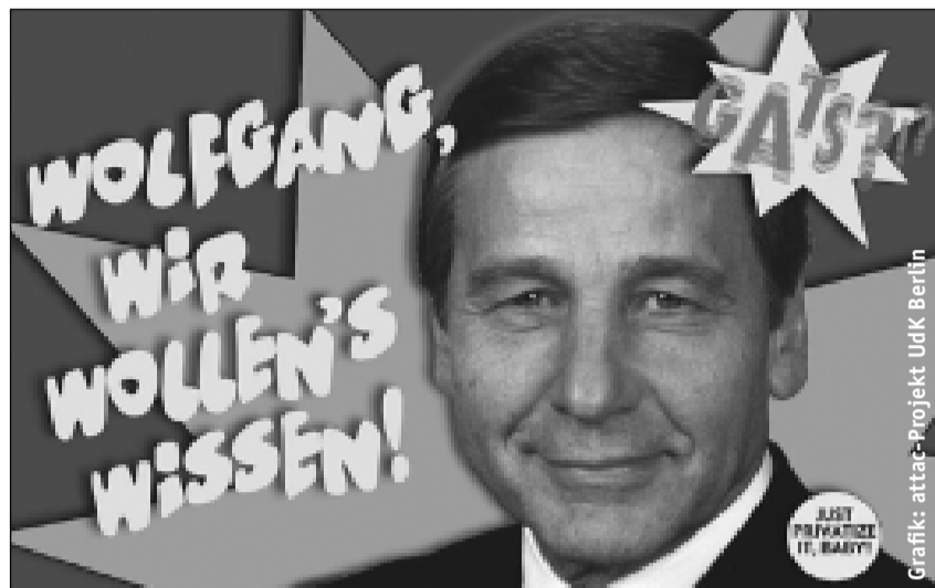
Grafik: attac-Projekt UoK Berlin

angebotenen Veränderungen bei der Erbringungsart 4, der zeitlich befristeten Arbeitsmigration. Daran sieht man, dass über diesen "Umweg", der von vielen Entwicklungsländern gefordert wird, doch die bestehenden