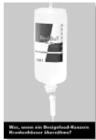
Wie, wenn ein Design-Blood-Messern Produktionskosten überhöht?

Neben den schon immer transnational arbeitenden Pharmaunternehmen haben vor allem große Krankenhauskonzerne und private Versicherungsge-