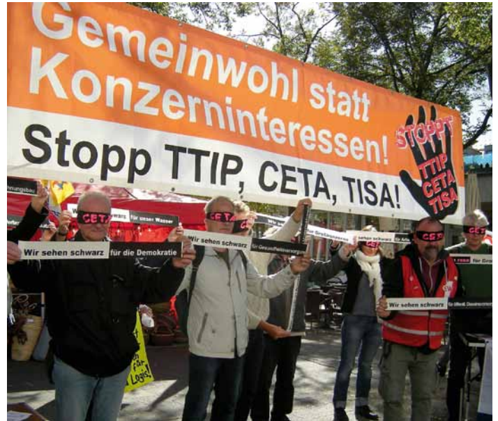
Europaweiter CETA-Aktionstag, Foto: www.ceta-aktionstag.de

bei über 35 Aktionen in mehr als 30 Städten ihren Protest zum Ausdruck. In Berlin führt eine Lärmdemonstration an den Landesvertretungen von Hessen, Hamburg und Baden-Württemberg vorbei, um die dort mitregierenden Grünen an ihre Verantwortung zu erinnern.