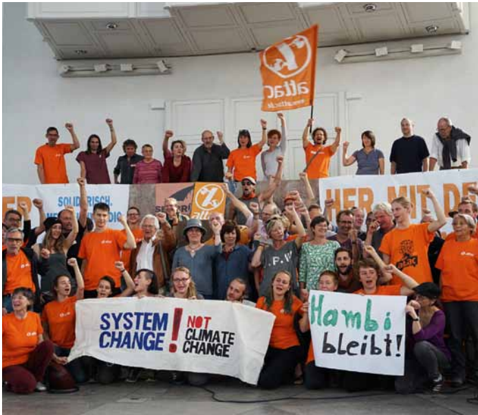
Besetzung der Frankfurter Paulskirche