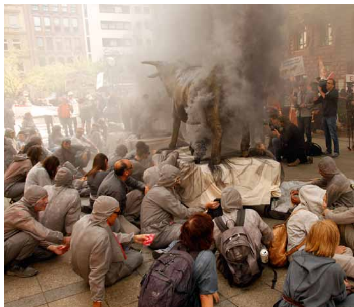
Performance »Finance for the People«