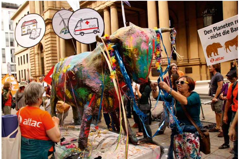
Performance »Finance for the People«, Foto: Arno Behlau

Die Attac-Forderungen und Alternativen zielen nicht darauf ab, innerhalb der bestehenden ökonomischen Strukturen und Verteilungsverhältnisse die Wirtschaft zu schrumpfen,