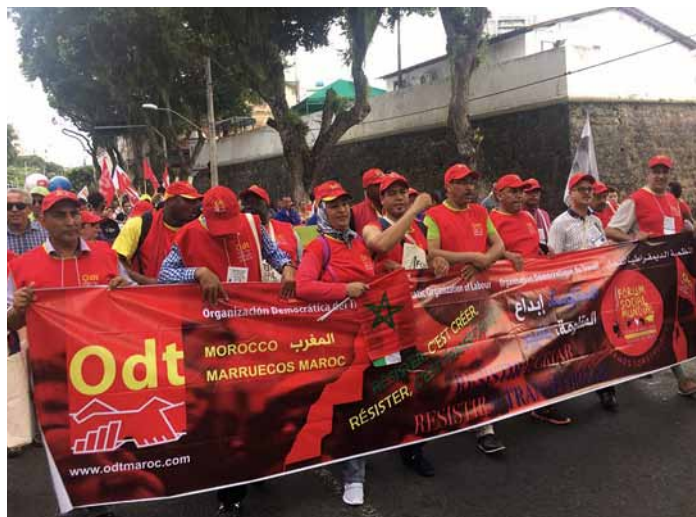
Weltsozialforum in Salvador de Bahia

zige Vereine zu sorgen, statt das Engagement von Attac zu behindern.