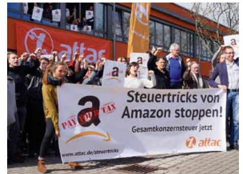
Attacies beim Ratschlag in Bamberg, 2018

In den vergangenen Monaten haben wir uns im Rahmen einer europaweiten Attac-Kampagne gegen die Steuertricks multinationaler Konzerne mit Aktionen zu Apple und Amazon für die Einführung einer Gesamtkonzernsteuer engagiert, und auch in den nächsten Monaten haben wir noch viel vor. Natürlich sind Apple und andere Digitalunternehmen wie Amazon oder SAP, die wir in den Fokus nehmen, Beispiele unter vielen, die für diese Kampagne als gutes schlechtes Beispiel dienen. Wir fordern die Einführung von Mindeststeuersätzen und einer Gesamtkonzernsteuer. Es müssen endlich wirksame Regelungen gegen Steuertricks und Steuerflucht etabliert werden. Wir werden nicht länger zusehen, wie Amazon, Apple, Ikea, VW und Co fast keine Abgaben an den Staat leisten und dabei gleichzeitig Rekordgewinne einfahren. Unterstütze uns dabei mit einer Spende!