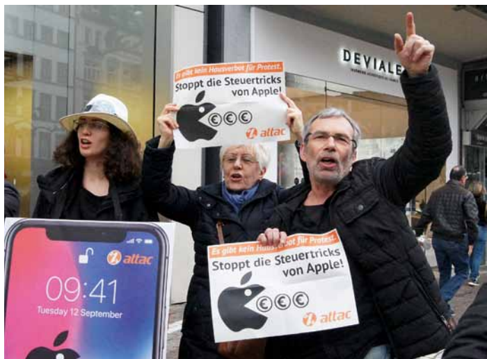
Flashmob im Frankfurter Apple Store