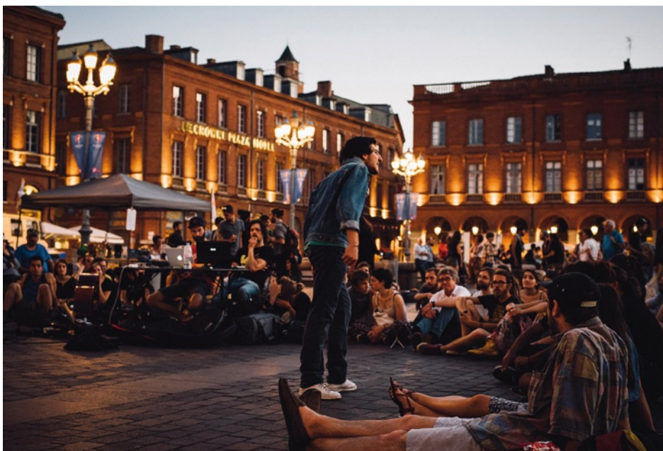
„Aufrecht durch die Nacht“, Foto: Nuit Debout Toulouse/flickr.com

Frankreichs sozialistische Regierung beschließt eine Arbeitsmarktreform am Parlament vorbei