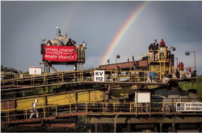
Ende Gelände, Foto: 350.org, Paul Levis Wagner