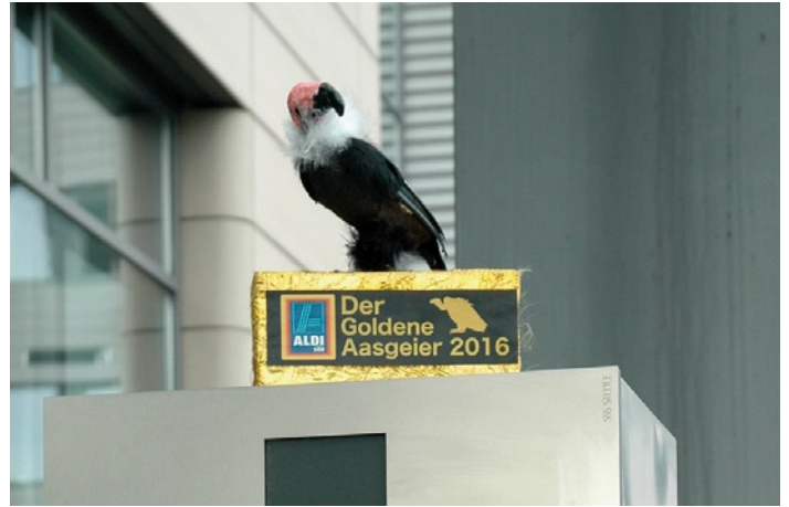
Goldener Aasgeier für Aldi