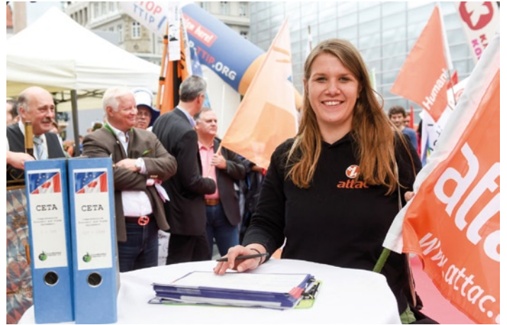
Volksbegehren gegen CETA

EU-Handelskommissarin Cecilia Malmström bekannt. Zugleich verweist sie auf die Möglichkeit, das EU-Kanada-Abkommen noch vor seiner Ratifizierung vorläufig in Kraft treten lassen. Sprich: Die Kommissarin will weiterhin die nationalen Parlamente aushebeln und CETA durch die Hintertür einführen.