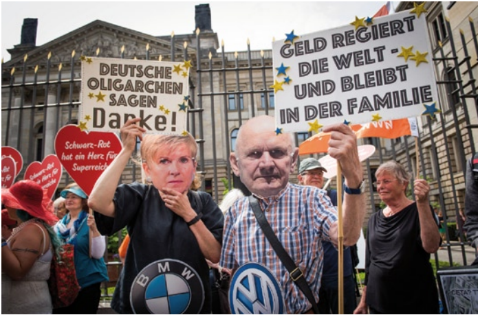
140.000 Unterschriften gegen Erbschaftssteuer