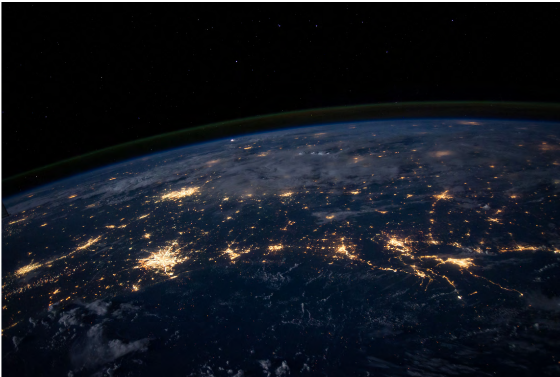
Seit 2012 treibt das Energiecharta-Sekretariat die geographische Expansion des ECT voran.

Seit 2012 treibt das Energiecharta-Sekretariat die geographische Expansion des ECT voran, obgleich diese während des Reformierungsprozesses kurzfristig ausgesetzt wurde. Vor allem afrikanische und asiatische Staaten werden lobbyiert, damit diese ebenfalls Vertragspartei des ECT werden. Ein erster Schritt auf diesem Weg ist die Unterzeichnung der nicht verbindlichen Internationalen Energiecharta. Verarmte und zum Teil ressourcenreiche Staaten, wie Tschad, Kolumbien, Uganda oder Nigeria stehen dabei im Visier. Das ist besonders bedenklich. Denn diese verfügen über weniger finanzielle und administrative Ressourcen, um sich gegen teure und komplizierte ISDS-Klagen verteidigen zu können. Zudem besteht in Ländern des Globalen Südens eine noch größere Notwendigkeit, die Produktionsbedingungen in der fossilen Brennstoffausbeutung stärker zu regulieren, da Umweltstandards häufig niedriger sind als im Globalen Norden – etwas, das eine ECT Mitgliedschaft wesentlich schwieriger gestalten würde. Somit droht der ECT, diese Länder noch stärker in die Abhängigkeit der Förderung und Verbrennung fossiler Brennstoffe zu drängen, statt auch dort die Energiewende einzuleiten. Vorteile einer ECT-Mitgliedschaft sind derweil nicht erkennbar, denn klare Hinweise, dass Investorenschutz tatsächlich Investitionen erhöht, gibt es nicht. 29