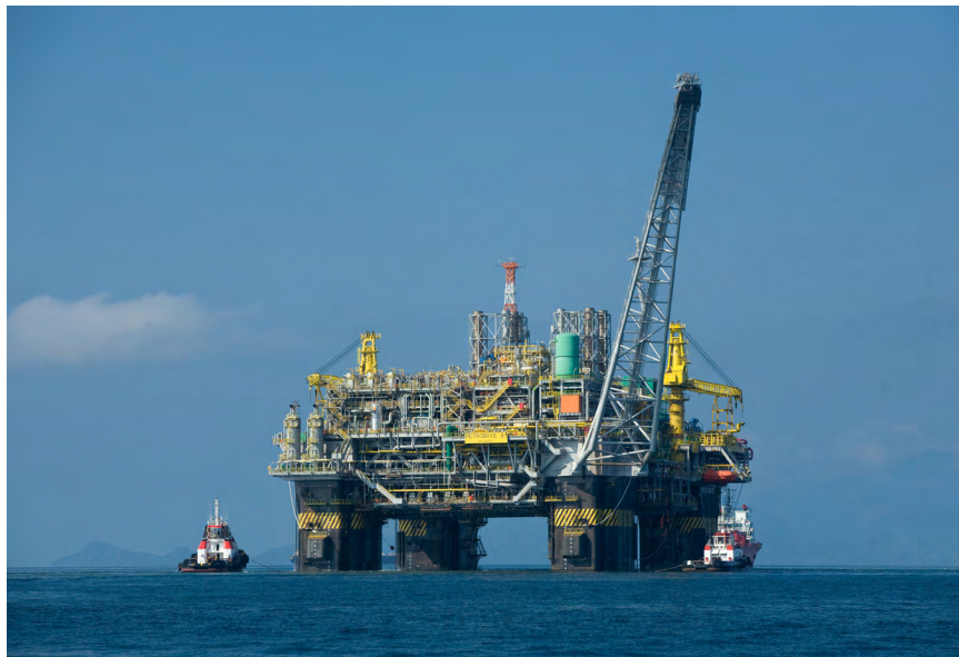
Italien wurde verklagt, weil das Land Ölbohrungen vor seiner Küste verbot.

Italien, 2017: Das britische Öl- und Gasunternehmen Rockhopper Exploration verklagt den italienischen Staat, weil das Unternehmen keine Konzession für Ölbohrungen in der Adria erhielt. Im Dezember 2015 hatte das italienische Parlament nach intensiven zivilgesellschaftlichen Protesten ein Verbot aller Öl- und Gasprojekte innerhalb von zwölf Seemeilen vor der italienischen Küste beschlossen. 15 Umwelt, Klima, die lokale Fischerei, die Tourismusbetreiber sowie Anwohner*innen seien gefährdet. Rockhopper hatte die Lizenz für das Offshore-Projekt Ombrina Mare 2014 von einem anderen Lizenzinhaber erworben. Das Unternehmen wusste, dass Genehmigungen fehlten und es öffentlichen Protest gab. 16 Trotzdem beschloss Rockhopper, Italien aufgrund der schließlich nicht erteilten Explorationsgenehmigung zu verklagen – weil dem Unternehmen „zukünftige Gewinne“ entgingen. Zusätzlich zu der Entschädigung für die tatsächlich investierten 40 bis 50 Millionen US-Dollar verlangt das Unternehmen 200-300 Millionen US-Dollar für hypothetische Gewinne, die die Ölförderung hätte erzielen können, wäre sie nicht verboten worden. 17