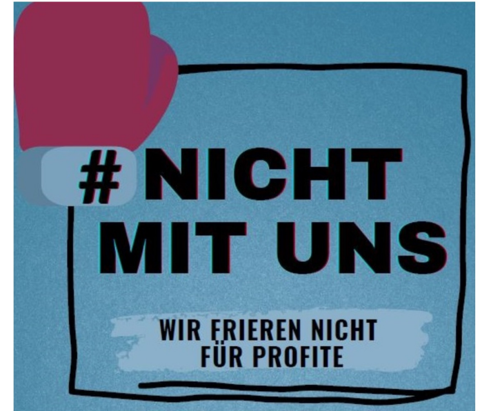
DGB und weitere

Aktion "#Nicht mit uns - Wir frieren nicht für Profite" am 11.09.2022 in Erfurt